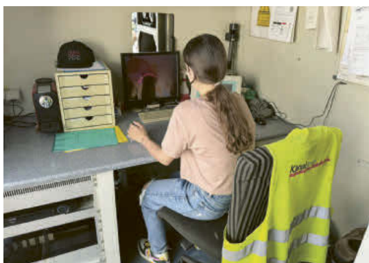
Mit einem ferngesteuerten Roboter wurden Löcher in Abwasserrohre gefräst.

Im Mai erlebten knapp 60 Schülerinnen und Schüler aus Wettingen einen besonderen Tag unter dem Motto «HGV – Schule trifft Wirtschaft».