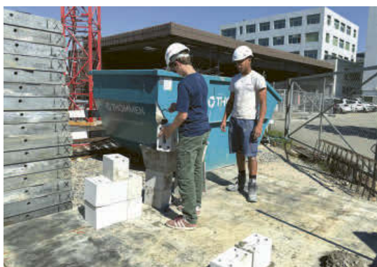
Unter Anleitung wurden die ersten Backsteine gesetzt.